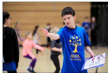
Elever i 6.klasse coacher elever i 1.klasse i kidsvolley.